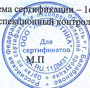
Схема сертификации – 1с(м). Инспекционный контроль – апрель 2023 года, апрель 2024 года.